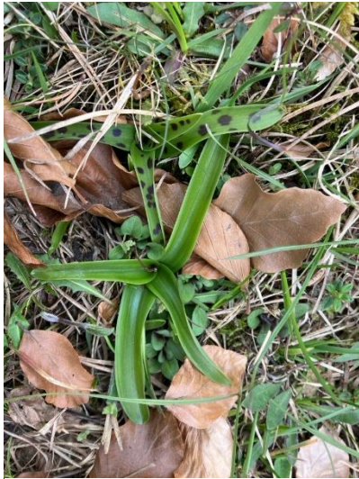
Mannetjesorchis ( Orchis mascula )

gebruikelijke' voorjaarsbloeiers; een combinatie die we nog niet eerder zagen. Ook niet op deze plek, omdat we er doorgaans véél later pas komen.