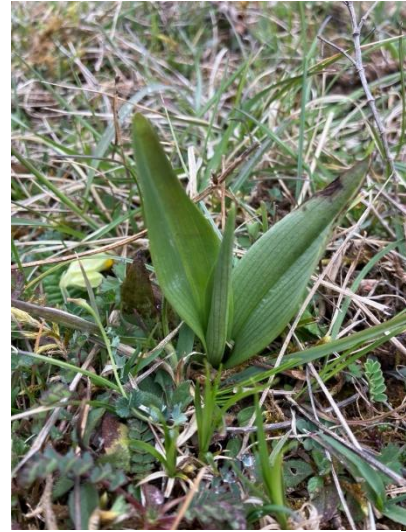
Vliegendorchis ( Ophrys insectifera )

Natuurlijk hadden we op voorhand bedacht dat het te vroeg zou zijn voor vrijwel alle orchideeën. We hoopten vooral op bloeiend Wildemanskruid ( Pulsatilla vulgaris ). In andere tijden van het jaar vinden we daar op zijn best nog wat pluizige bolletjes van, maar het is één van de eerste soorten in de kalkgraslanden. We werden niet teleurgesteld! Overal waar we keken vonden we het prachtige samenspel van het diep paarse Wildemanskruid, het eveneens diep paarse Ruig viooltje ( Viola hirta ) en de gele Gulden sleutelbloem. Dat zou, zo zou blijken, de rode draad worden van dit bezoek.