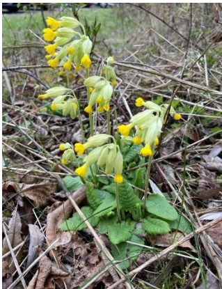
Gulden sleutelbloem ( Primula veris )

Maar niet voordat we op 02 april nog de Sint-Pietersberg bezochten. Hoewel het op een steenworp afstand van mijn ouderlijk huis is, waren we daar zo vroeg in het jaar nog niet geweest. We kiezen dan vaak voor de hellingbossen met hun uitbundige voorjaarsflora. Maar ook daar hadden we dit jaar al rondgelopen!