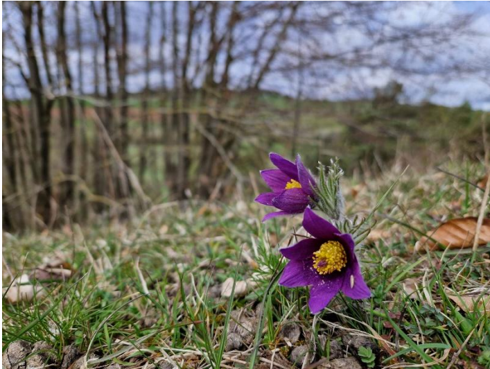
Wildemanskruid ( Pulsatilla vulgaris )

Hoewel we na aankomst bij onze accommodatie al een klein maar zeer de moeite waard uitstapje maakten naar de Möschelberg (bij Lissendorf), stonden vandaag de Kalvarienberg en omgeving (Giesheul) op het programma.