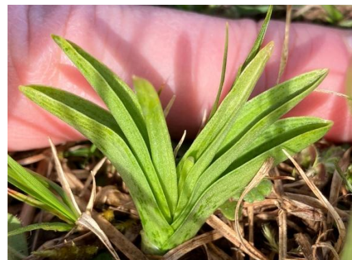
Grote muggenorchis ( Gymnadenia conopsea )

We hoefden niet vroeg weg uit onze accommodatie. Dat bood ruimte aan nog één bezoek aan een klakgrasland voor de terugreis. Het werd de omgeving van Gönnersdorf (Mäuerchenberg, Hierneberg en Pinnert). Ook daar de pracht van Wildemanskruid, Gulden Sleutelbloem en Ruig viooltje, maar het leek hier rijker aan vegetatieve orchideeën. Naast een veelheid aan Vliegenorchis en nachtorchis, lukte het om één andere soort te vinden: Grote muggenorchis ( Gymnadenia conopsea ), althans naar ons oordeel. Nog nauwelijks groter dan de dikte van een vinger. Nauwgezet speuren loont blijkbaar (en is ook gewoon heel erg leuk om te doen). We hebben ongetwijfeld ook nog veel gemist, want we kropen nergens rond.